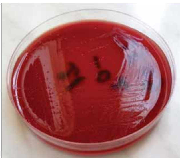
FIGURA 1. Cultură Clostridium difficile pe mediu agar-sânge, colonii non-hemolitice, de 2-4 mm în diametru, cu suprafață mată

după decontaminarea prealabilă a probei de scaun prin tratarea cu căldură sau alcool. După incubarea timp de câteva zile la temperaturi de 20-25°C, pot crește coloniile gălbui, plane, cu margini neregulate și cu aspect de sticlă mată. Sensibilitatea culturii poate crește până la 100% prin utilizarea mediului ChromoID, agar îmbogățit cu taurocolat de sodiu, gălbenuș de ou, tripticază-soia și sânge de berbec (34) (Figurile 1 și 2).