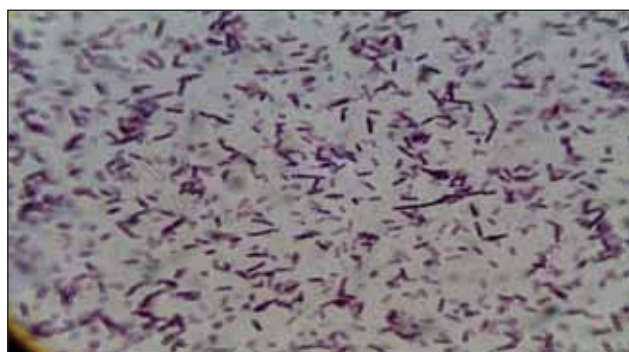
FIGURA 3. Frotiu colorat Gram – cultură Clostridium difficile – microscopie optică

pozitive necesită confirmare prin metodele Rapid ANA (sistem de identificare rapidă a izolatelor anaerobe) sau MALDI-TOF (matrix-assisted laser desorption/ionization-time of flight) (35).