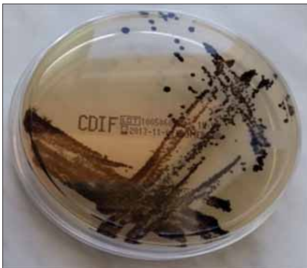
FIGURA 2. Cultură Clostridium difficile pe mediu cromogen-chrom ID C. difficile agar (bioMérieux) – colonii negre

Din coloniile suspecte se realizează testele de prezumpție: morfologia coloniilor, aspectul microscopic la colorația Gram (Figura 3) și caracteristicile biochimice, cu pozitivarea testelor indol și hidroliza L-prolin-naftalamida. Testele de prezumpție