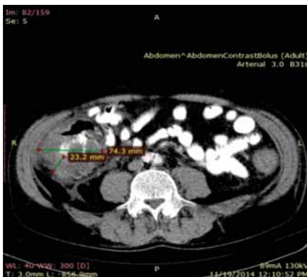
FIGURA 5. Imagine de computer tomograf abdominal – colon ascendent – grosime perete 23,2 mm, diametru transversal 74,3 mm (41)

Studiile actuale sunt orientate pentru dezvoltarea unor teste ultrasenzitive ELISA (enzyme-linked immunosorbent assays) care să permită detecția