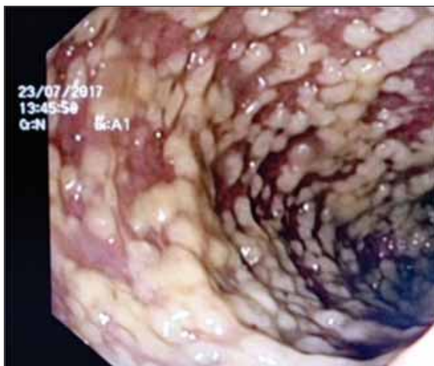
FIGURA 4. Imagine de colonoscopie – infecție Clostridium difficile , inflamație de mucoasă cu arii acoperite de depozit gălbui 1-4 mm

Examenul colonoscopic și anatomo-patologic al pieselor de biopsie, chirurgicale sau necroptice, poate stabili diagnosticul de ICD prin evidențierea aspectelor tipice, cu depozite gălbui și pseudomembrane (Figura 4). Microscopic, se descriu epiteliu distrus, cu arii focale de necroză, infiltrat neutrofilic la nivelul mucoasei și aglomerări de leucocite fragmentate, fibrină, mucus și detritusuri celulare (10,16).