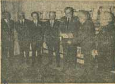
— ...a redactat și un manifest intitulat „Defense et illustration de la langue