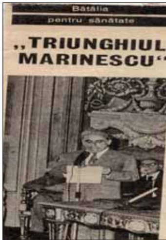
FIGURA 3. Gheorghe Marinescu Dinizvor, Rev. Flacăra, 1972

1972 – Ales membru al Academiei de Științe, Litere și Arte Frumoase din Besançon (Franța), unde, cu prilejul discursului de recepție, a prezentat comunicarea „Victor Hugo, în viziunea unui medic român”.