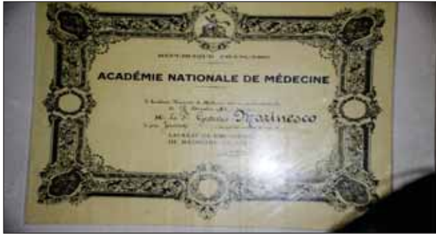
FIGURA 2. Gheorghe Marinescu, Premiul „Jansen” al Academiei Franceze de Medicină, 1972

A fost membru în peste 20 de societăți științifice și organisme academice din Europa și din Statele Unite (3).